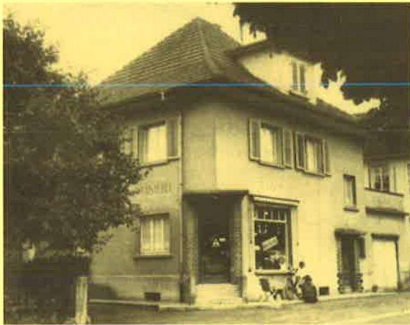
Die Metzgerei – fast unverändert