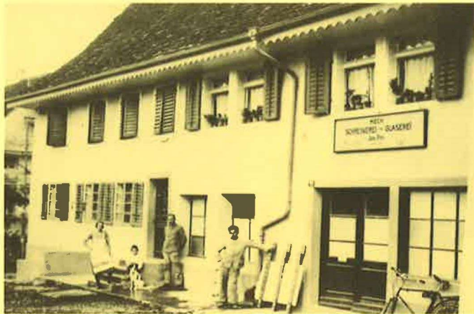
Hier befand sich vorher die Velohandlung Hutmacher