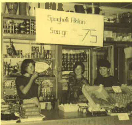
In der alten Gnossi