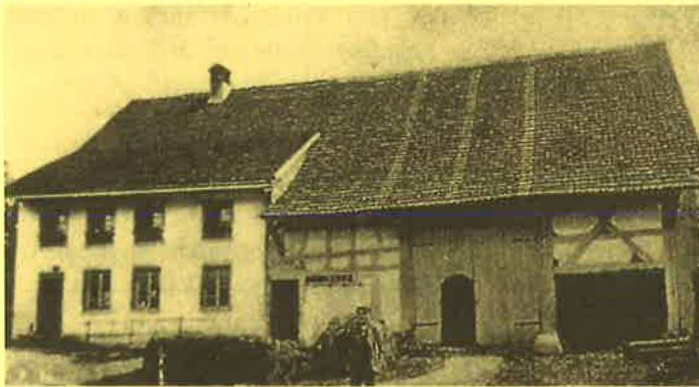
Konsumdepot im Binderhaus